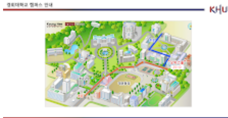
붙임2. 경희대학교 오비스홀 오시는길.png 982K